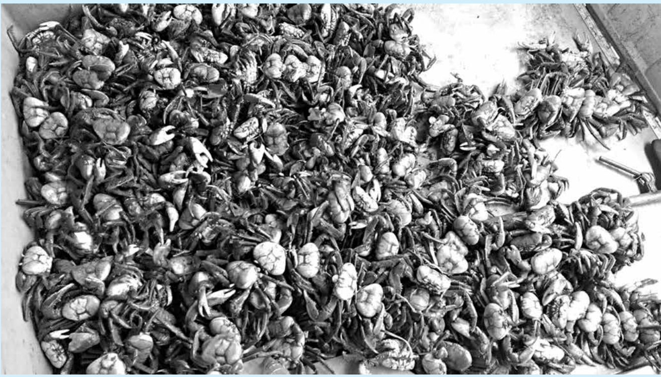
Caranguejos foram apreendidos em feiras livres de João Pessoa, Bayeux e Santa Rita durante operação da Polícia Ambiental

O Batalhão de Polícia Ambiental apreendeu mais de 500 caranguejos-uçá, no domingo (29), durante operação nas feiras livres de João Pessoa, Bayeux e Santa Rita. Neste período está proibida a captura do animal, pois acontece a "andada", que é quando a espécie sai das galerias para o acasalamento e liberação de ovos.