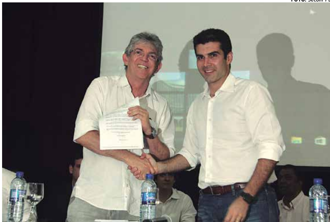
Governador Ricardo Coutinho e o ministro Helder Barbalho durante solenidade em Campina Grande

O ministro Helder Barbalho, no início de sua fala, apresentou tópicos do cronograma sobre o andamento das obras do Projeto de Integração do Rio São Francisco e confir-