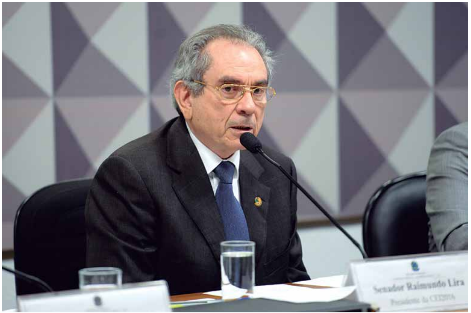
Proposta de Emenda à Constituição do senador paraibano Raimundo Lira fixa em 50 anos a idade mínima para ingresso no STF

A prefeita alertou para o fato de "sem o empenho que a gestão anterior deveria ter providenciado, teremos que formalizar a situação através de um processo encaminhado ao Tribunal de Contas e fazer um empenho relativo a dezembro, que é uma espécie de cheque geral do pagamento, para que os funcionários possam receber."