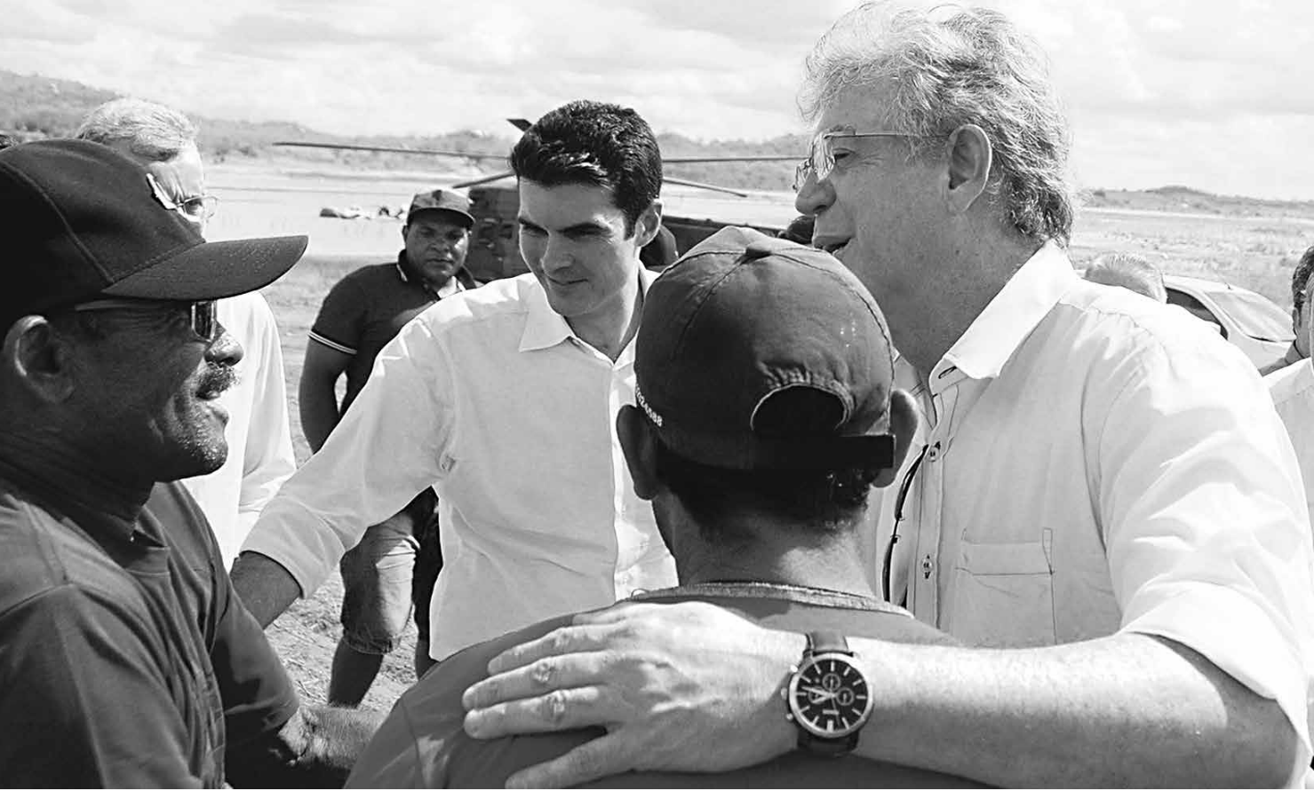
Governador Ricardo Coutinho afirmou que o Estado está cumprindo sua parte a respeito das obras complementares à Transposição

Inspeção governamental passou pelos açudes de Poções e Camalaú