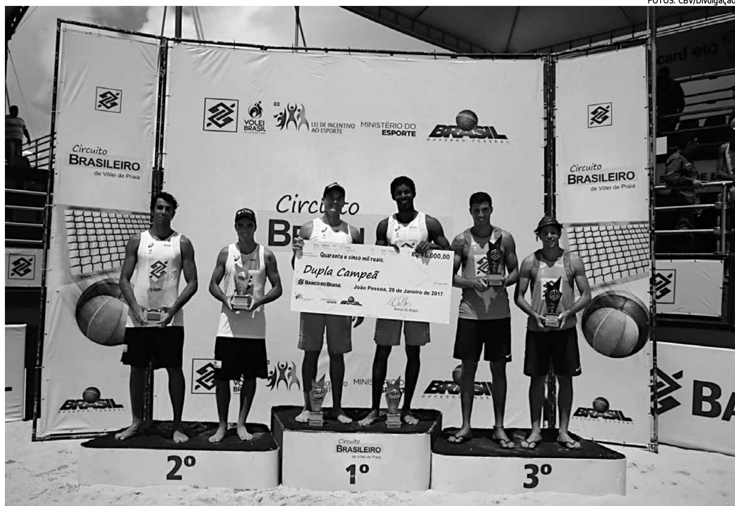
A dupla campeã recebeu um cheque no valor de R$ 45 mil pela conquista da etapa de João Pessoa no Circuito Banco do Brasil Open