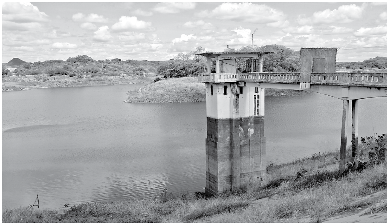
Açude de São Gonçalo é um dos afetados pelos invernos irregulares dos últimos anos e que motivaram o racionamento de água

O setor 2 do município será contemplado com o abastecimento de água também durante três dias da semana. Nas quintas, sextas e sábados receberão fornecimento de água as localidades urbanas de Jardim Santana, Estação, Jardim Iracema, Jardim Brasília, Lagoa dos Patos, Mutirão, Projeto Ma-