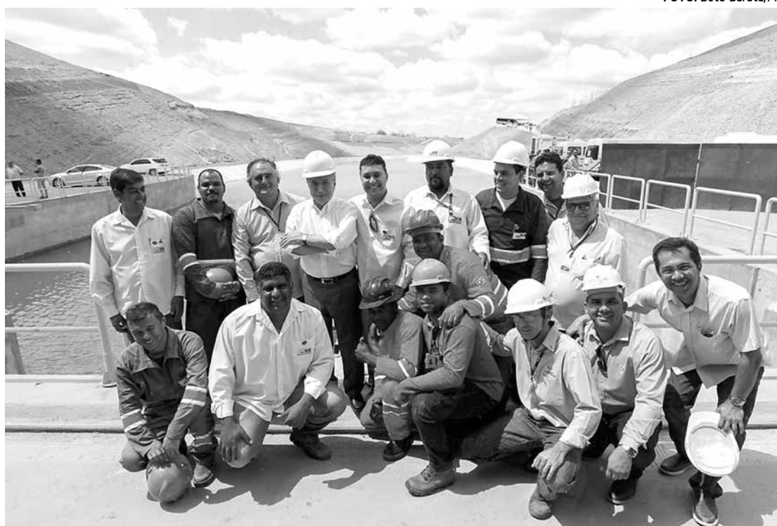
Temer ao lado de engenheiros e operários de mais uma etapa das obras de transposição do São Francisco

Segundo o Ministério de Integração Nacional, to-