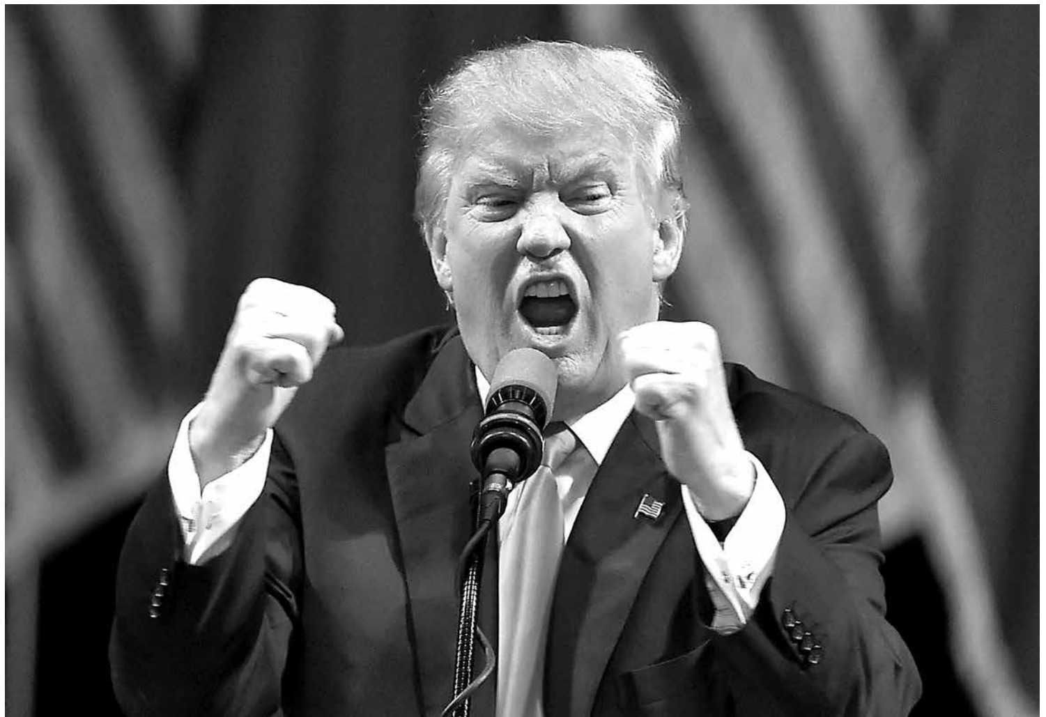
Trump despertou a revolta da comunidade internacional ao anunciar medidas proibindo a entrada de refugiados nos Estados Unidos

O presidente Trump respondeu às críticas e manifestações ocorridas no fim de semana alegando que a restrição não foi direcionada aos muçulmanos, mas aos sete países classificados como origem de terroristas na administração de Barack Obama. Em nota, ele garantiu que os vistos voltarão a ser liberados em 90 dias, mas que a