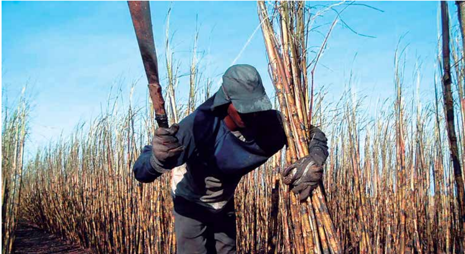
Nos últimos 20 anos, foram encontradas 52 mil pessoas trabalhando em condições análogas à de escravos no Brasil, segundo a CPT

O grande número de processos contrasta com a quantidade ínfima de condenações por esse crime, segundo o coordenador-geral da Comissão Nacional para Erradicação do