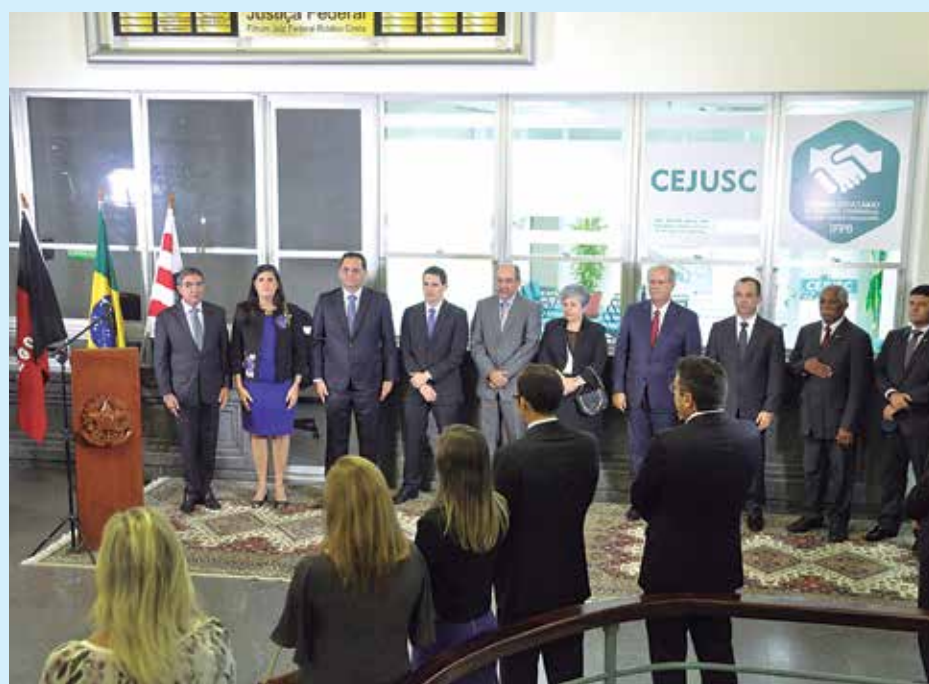
Evento, realizado ontem à noite, contou com a presença de várias autoridades

É a primeira deste tipo criada na Seção Judiciária da Paraíba e visa ofertar atendimento de excelência ao cidadão, com ampla recepção, com duas salas para as audiências conciliatórias e gabinete do magistrado. A central seguirá uma tendência mundial de promover a solução de conflitos no início do processo judicial. As audiências acontecem das 8h às 12h e das 14h às 18h, de segunda