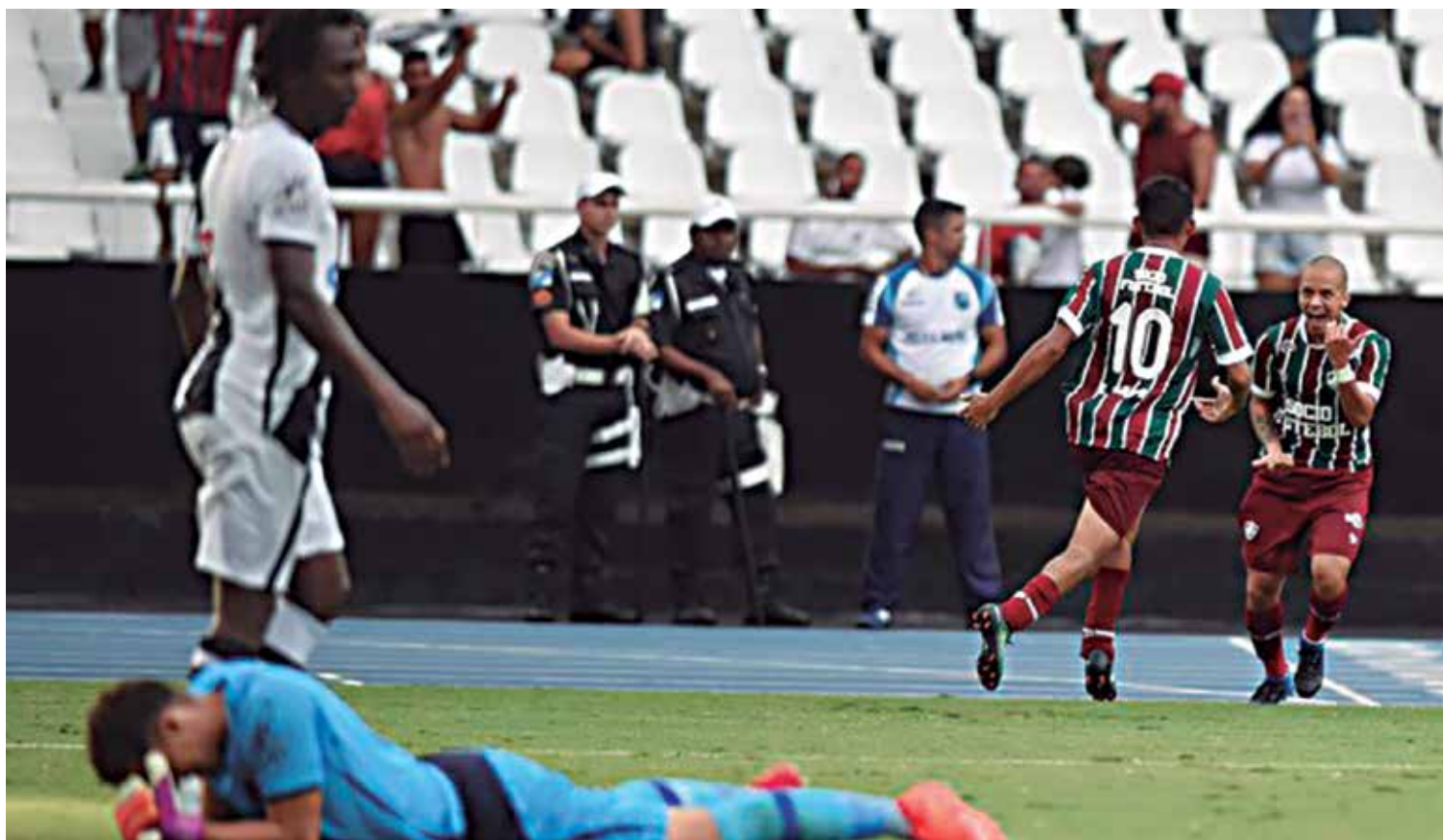
A equipe vascaína até que melhorou de produção no segundo tempo, mas não conseguiu evitar a derrota para tricolor das laranjeiras