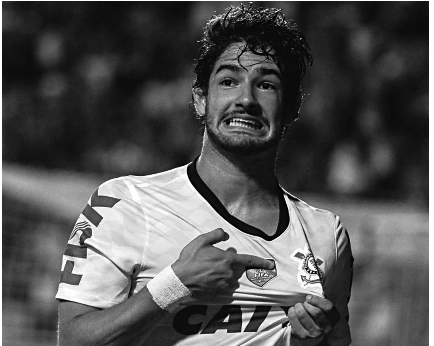
Alexandre Pato deu um grande prejuízo ao Corinthians de R$ 43 milhões e agora recupera uma pequena parte desse valor com a venda